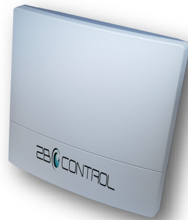
Antenna BLE con connessione TCP/IP Poe

Controllo personale reperibile: dotando il personale di un beacon indossabile, è possibile avere in tempo reale la sua ubicazione, per l'ottimizzazione degli interventi.