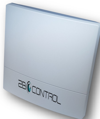
Antenna UWB con connessione UTP verso il concentratore

Il concentratore dialoga a sua volta con il modulo software Guardian Tracking Indoor trasferendo i dati già elaborato dalle posizioni assolute del transponder.